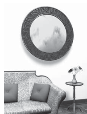
MARCO DE ESPEJO EN UNA SALA

Tú decides en que categoría quieres participar, Comercial o Artística . Si llegara algún trabajo sin especificar la categoría, el jurado calificador le asignará la que más se ajuste al diseño.