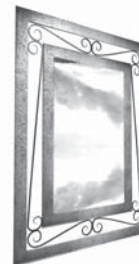
Ejemplo de MARCO DE ESPEJO COMERCIAL