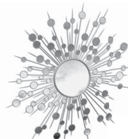
Ejemplo de MARCO DE ESPEJO ARTÍSTICO