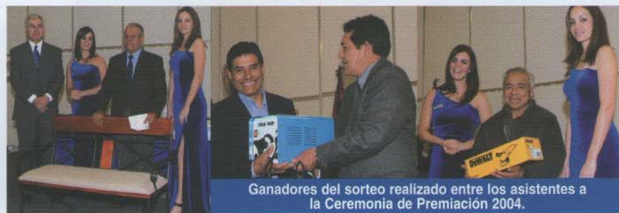
Ganadores del sorteo realizado entre los asistentes a la Ceremonia de Premiación 2004.