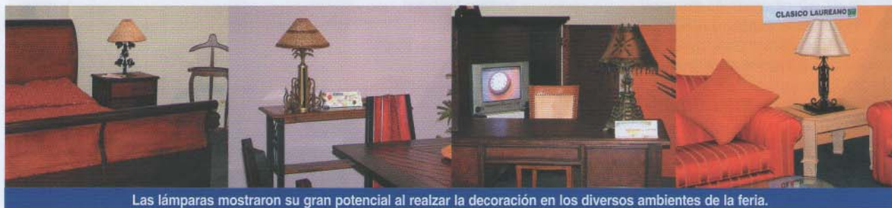
Las lámparas mostraron su gran potencial al realzar la decoración en los diversos ambientes de la feria.

Para el mes de Diciembre se tiene programado realizar la tercera exhibición de las lámparas finalistas del concurso en el centro comercial Larcomar.